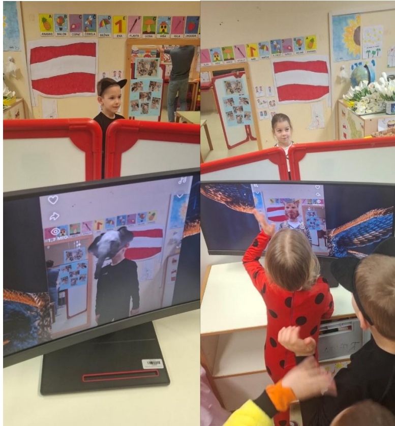
Delavnica virtualne preobrazbe z zunanjim izvajalcem