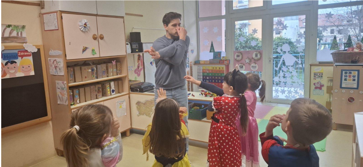
Virtualna preobrazba – delavnica z zunanjim izvajalcem