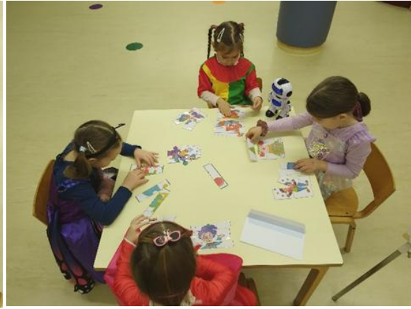
Sestavljanje pustnih sestavljanek