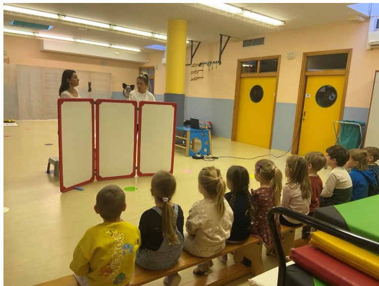
Dramatizacija: Kako se je mišek maškara

Robotek Brin nas je tokrat popeljal v čarobni pustni čas mask, norčij in plesa. Dan smo začeli z igrivo dramatizacijo Kako se je mišek maškara, ki je bila otrokom zelo všeč. Pustno raziskovanje pa smo nadaljevali z dejavnostjo »Kdo se skriva za masko«, kjer so se otroci v ločenih prostorih povezali preko ZOOM povezave. Ob ugibanju identitet prijateljev pred zaslonom so na praktičen način spoznavali, da so digitalne naprave odlično orodje za zabavo in učenje, hkrati pa so prek igre ponotranjili cilj, da smo v digitalnem svetu lahko hitro zavedeni in včasih ne komuniciramo s tisto osebo za katero mislimo. Dejavnost smo nadgradili s sodelovanjem zunanjega izvajalca in sicer z delavnico virtualne preobrazbe, kjer so AI filtri otroke v trenutku spremenili v živali, kar je spodbudilo gibanje in posnemanje različnih živalskih vzorcev. Za konec pa so se otroci preizkusili še v vlogi programerjev. Pri vodenju Bee-botkov in usmerjanju svojih vrstnikov –»robotkov« – po mreži so spoznali, da je vsako kompleksno navodilo sestavljeno iz več manjših, vnaprej dogovorjenih osnovnih ukazov, kot so koraki naprej, nazaj ali levo in desno. Otrokom so ob dejavnostih uživali in se zabavali.