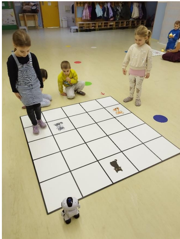
Gibanje na mreži Otrok – robotek